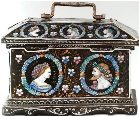
LIMOGES Coffret, Hercule et Déjanire Seconde moitié du XVI e siècle Bois, émail polychrome, rehauts d'or sur cuivre H. 14 cm ; L. 18 cm

d'après deux œuvres en volume du musée des Beaux-Arts de Dijon.