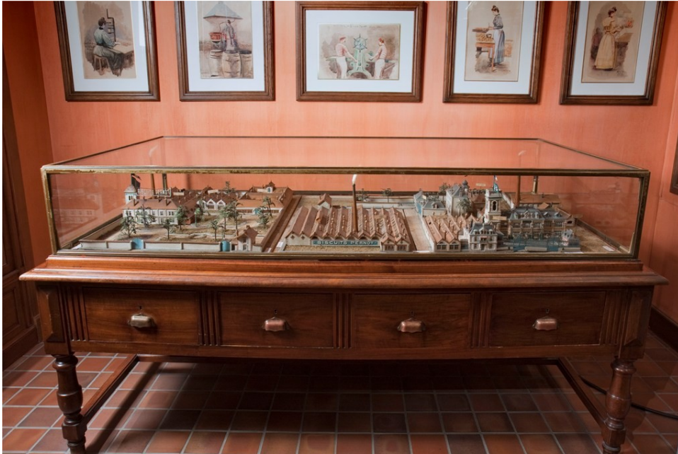
👁 Maquette de l'usine PERNOT

☞ Entre maintenant dans la boutique des biscuits PERNOT et place-toi devant la maquette de l'usine .