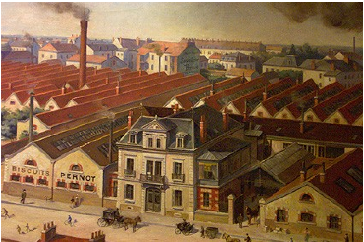
👁️ Tableau de Gabriel CHAPUIS « L'usine PERNOT », 1897

☞ Monte au 1 er étage et cherche le tableau de l'usine PERNOT de G. Chapuis (avance dans la rue commerçante reconstituée et tourne à la 3 ème allée à gauche).